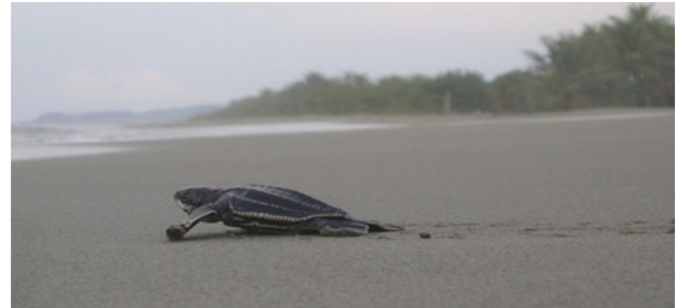
Monitoreo de tortugas. Acandí, Chocó

Para el caso de Playón o playa Chilingo es monitoreada una extensión de 3 kilómetros a partir de secciones de 200 metros, donde también se cuenta con un vivero. Ya en esta playa contigua a la cabecera municipal de Acandí, el equipo total de monitoreo se compone de ocho (8) personas, donde tres (3) son técnicos en manejo ambiental los cuales además de ejercer sus actividades de monitoreo apoyan actividades de educación ambiental en los concejos locales, además cuatro (4) auxiliares de monitoreo y un coordinador con funciones de sistematizar la información en la base de datos Chelys, analizarla y presentar los informes correspondientes a PNN, donde a partir del uso de un paquete estadístico son calculadas las variables de proyección de reproducción de las tortugas en términos de mortalidad, efectividad, frecuencia de llegada de tortugas y ubicación de los nidos, etc. Dichos equipos de monitoreo colectan la información que se sintetiza en la Cuadro 3.