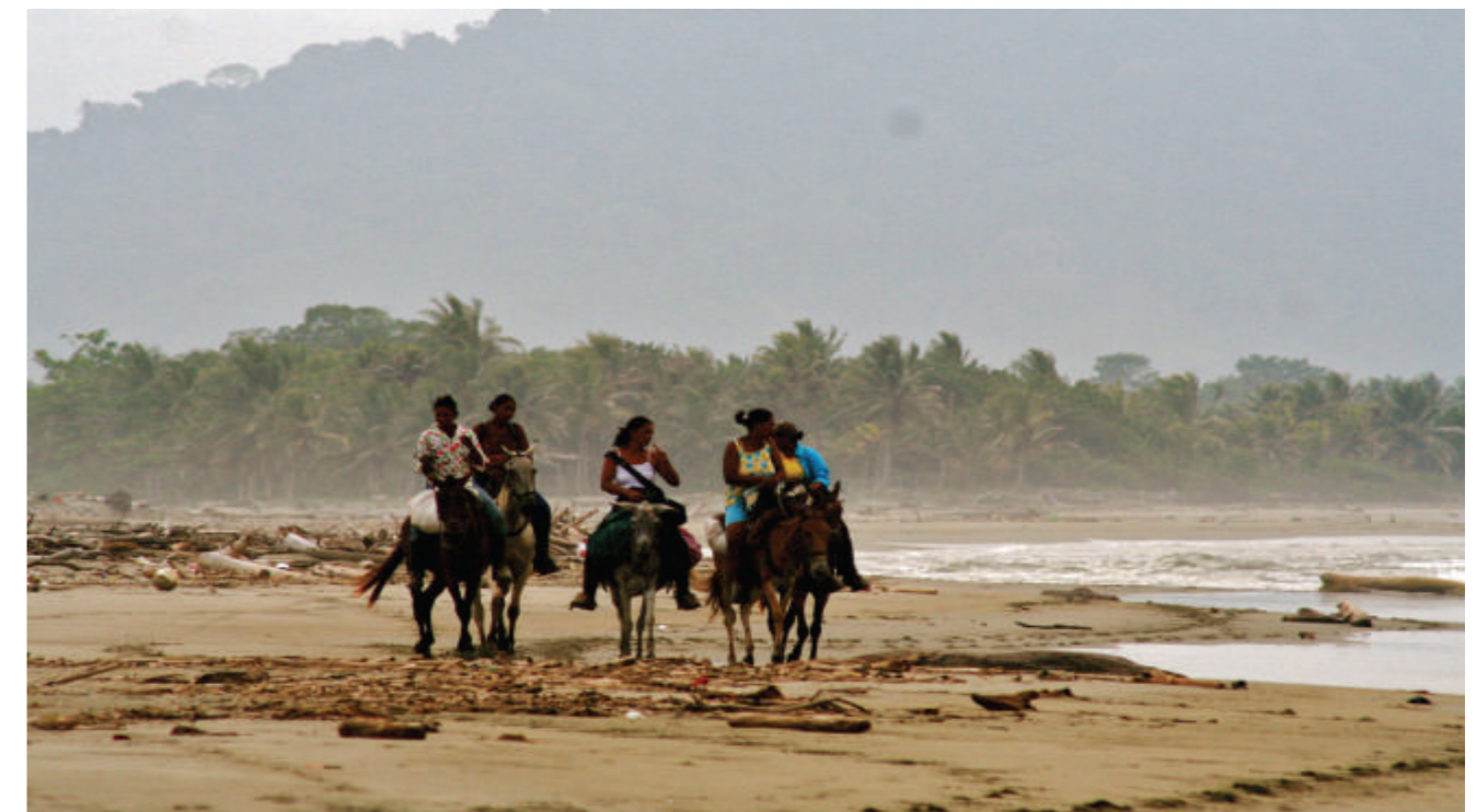
Monitoreo de tortugas. Acandí, Chocó

El equipo está conformado por cuatro (4) personas (3 de consejos locales Chugandí, Tibirre y Furutungo) y una Coordinadora que brinda acompañamiento al equipo para la planeación de los recorridos, el seguimiento de casos de deforestación y acuerdos comunitarios. Los equipos de monitoreo colectan la información que se presenta en la Cuadro 4.