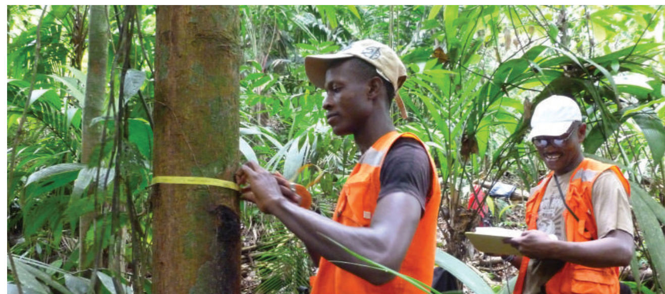
Establecimiento de Parcelas Permanentes para el Monitoreo de Carbono. Acandí, Chocó

Darién y, además de sus funciones en el proyecto, realiza funciones y actividades necesarias, independientes del proyecto REDD+ para Cocomasur." En la Cuadro 1 se presenta un breve resumen de las variables y frecuencia del monitoreo forestal.