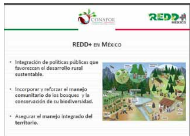
Presentación México. Políticas y Medidas. Agosto 2015.

Tal como en otros países, las causas de deforestación en México no son únicas, y no están ancladas en el sector forestal, por lo que el país ha decidido abordarlas desde diversos frentes de manera coordinada. En este marco la