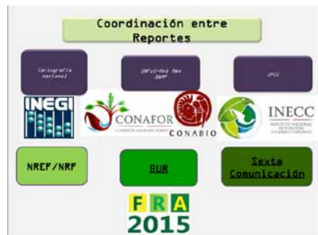
Presentación México. Niveles de Referencia de Emisiones Forestales. Agosto 2015.

En el 2016 México espera tener una primera evaluación de los resultados de la evaluación del NREF. Se está evaluando si a fines de 2016 en el BUR se presentan tanto el NREF como el anexo técnico.