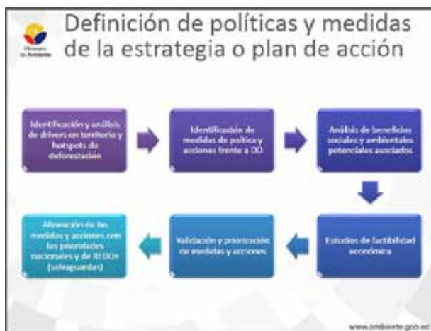
Presentación Ecuador. Políticas y Medidas. Agosto 2015.

Al inicio del Programa Nacional Conjunto ONU-REDD en Ecuador hubo muchos retos que obligaron a definir el enfoque de REDD+ y se buscaron las oportunidades para integrar REDD+ en las políticas nacionales claramente definidas sobre cambio climático.