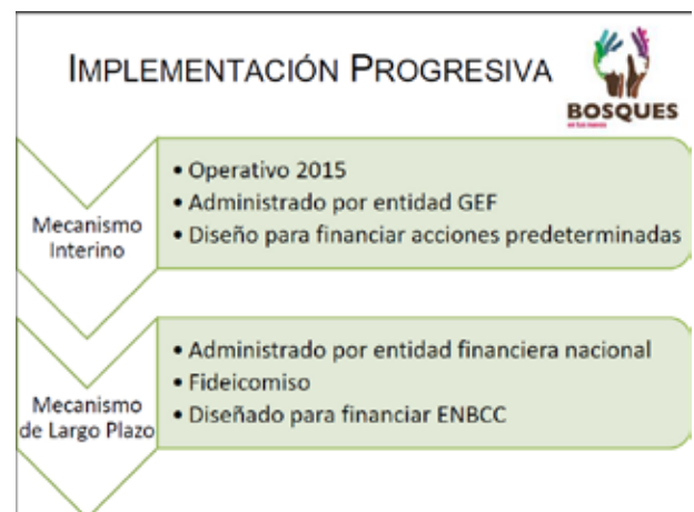
Presentación Perú. Financiamiento de REDD+. Agosto 2015.

La Estrategia Nacional de Bosques y Cambio Climático trasciende la misión del sector ambiente y debe ser un compromiso de los diversos sectores relevantes más allá de gobierno, incluyendo sector privado, sociedad civil, comunidades, etc. Los recursos provienen y responden a diversas necesidades: públicos para gobernanza y condiciones habilitantes; crédito rural para mejora forestal y agropecuaria; y privados para mercados de carbono y pago por servicios ecosistémicos.