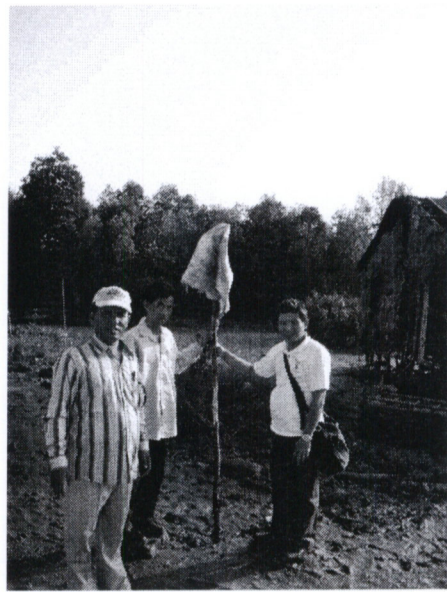
រូបភាពចុះបោះបង្គោលសម្គាល់សម្រាប់សាងសង់ប៊ែមយាម