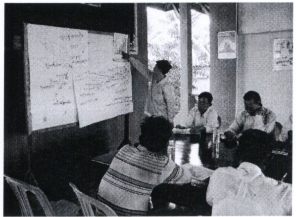
រូបភាពប្រជុំពិគ្រោះយោបល់នៅសាលាឃុំអូរខកញ្ជាហោង