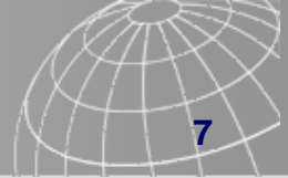
Illustration non validée