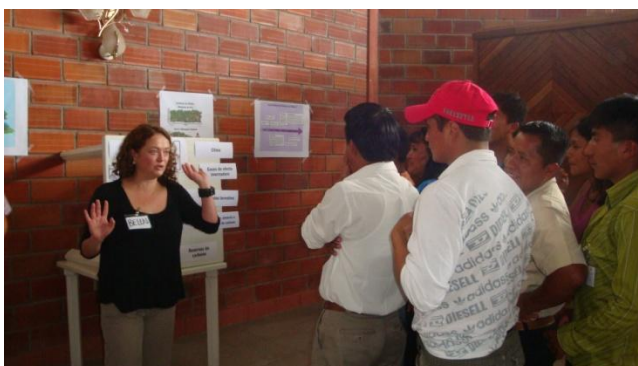
Interiorización de los conceptos de cambio climático