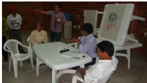
Presentación del periódico y de la emisión de radio sobre los estándares