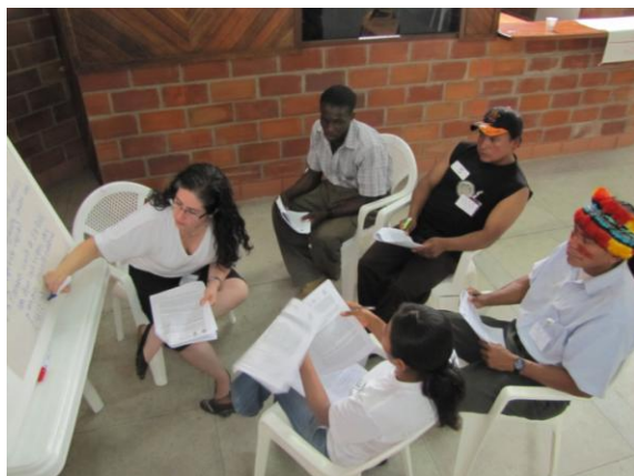
Trabajo en grupos sobre el PNC