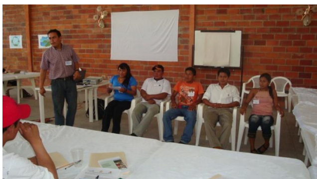
Juego "Teléfono dañado"