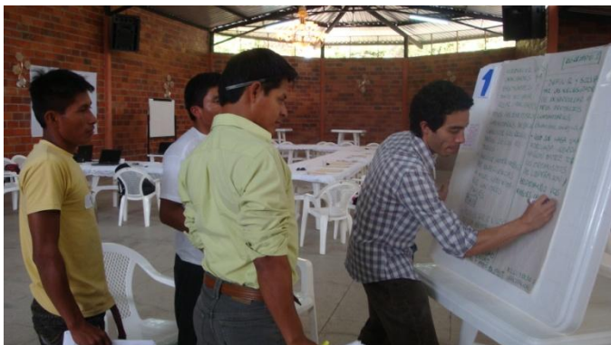
Trabajo en grupos para obtener comentarios sobre el PNC