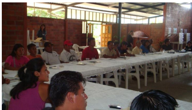
Plenaria: presentación del trabajo en grupo