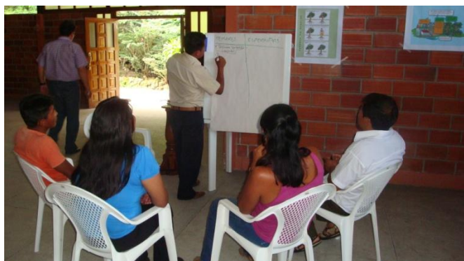
Trabajo en grupo para determinar las esperanzas y temores