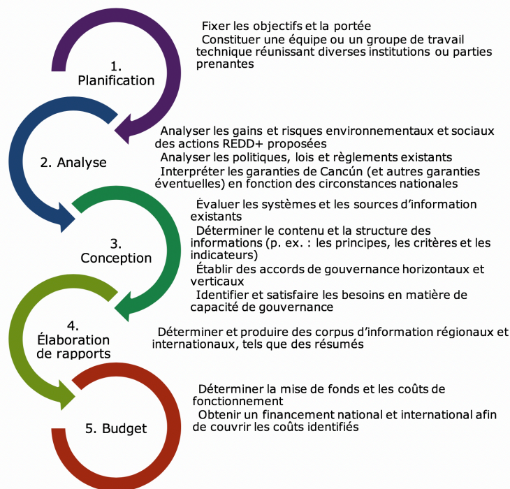
Figure 2. Processus optimisé pour l'élaboration d'un système d'information sur les garanties en Afrique, à partir des expériences pays collectives recensées à ce jour

4. La conception d'un SIS et l'instauration simultanée d'une stratégie nationale REDD+ : à l'instar des pays d'Asie-Pacifique et d'Amérique latine et des Caraïbes, plusieurs pays d'Afrique ont souligné la complexité inhérente à l'identification des besoins du SIS en matière d'informations ; il en est de même pour la structure, difficile à cerner sans avoir une idée précise des actions REDD+ que le pays doit entreprendre dans le cadre de sa stratégie nationale. Par conséquent, les conceptions préliminaires du SIS sont susceptibles d'être maintes fois réexaminées tandis que les processus liés à la stratégie nationale REDD+ touchent à leur fin.