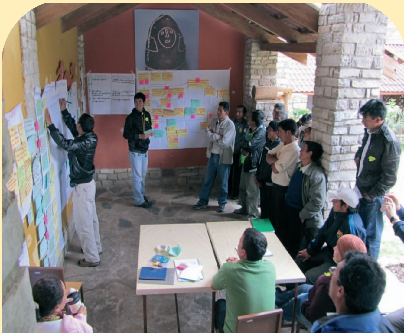
Foto 2: Taller participativo, Concesión de Conservación Alto Huayabamba

El interés de los usuarios se puede motivar de diferentes maneras, un ejemplo son los talleres participativos realizados en la Concesión de Conservación Alto Huayabamba (CCAH) con apoyo de la Alianza para el Clima, Comunidades, Biodiversidad (CCBA), otro son los foros accesibles a todos los actores afectados. En estos foros, deberán participar las comunidades con responsabilidades claras y permanentes durante todo el proceso de desarrollo e implementación y no sólo los líderes.