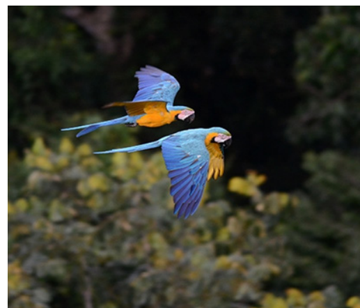
Les garanties de Cancún exigent que les actions REDD+ soient cohérentes avec la conservation de la biodiversité.