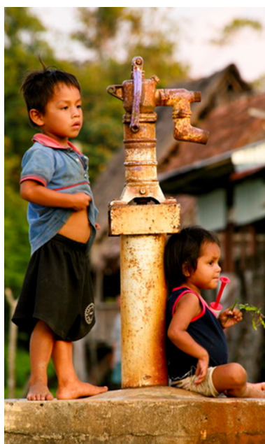
Les forêts jouent un rôle essentiel pour l'approvisionnement en eau potable.

Adoptées à Cancún en 2010 lors de la 16e Conférence des Parties à la Convention Cadre des Nations Unies sur les Changements Climatiques (CCNUCC-COP 16) sept garanties, appelées "garanties de Cancún", doivent être prises en compte et respectées lorsque des activités REDD+ sont entreprises. Le Programme ONU-REDD a conçu un cadre conceptuel et des outils afin de permettre aux pays de développer des "approches pays" flexibles, qui reflètent leurs circonstances nationales, tout en répondant aux garanties de Cancún et aux autres décisions de la CCNUCC qui s'y rapportent. Une telle approche pays aide à réduire les risques sociaux et environnementaux liés à la REDD+ et à promouvoir les bénéfices qui y sont aussi associés.