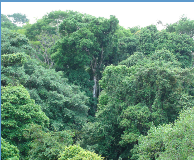
La gestion durable des forêts dans le cadre de la REDD+ au Costa Rica bénéficiera d'un processus participatif de planification.

Le Programme ONU-REDD a apporté un soutien directement le Costa Rica pour élaborer son système d'information sur les garanties (SIS) dans le cadre d'un appui ciblé fourni par le Programme. Le Fonds National de Financement Forestier (FONAFIFO) est l'institution gouvernementale en charge de la REDD+ au Costa Rica. Il a œuvré au développement d'un cadre conceptuel et d'une méthodologie pour le SIS du pays. Cela a impliqué un processus participatif de consultation des parties prenantes à la REDD+ au niveau national, dont le Secrétariat REDD+ du Costa Rica et des représentants des territoires autochtones, des communautés locales et des institutions pertinentes. Le FONAFIFO a également revu le cadre législatif du Costa Rica, comprenant les PLR pertinentes et les instruments nationaux de planification. Une proposition d'indicateurs pour le SIS sur la manière dont les garanties de Cancún sont prises en compte et respectées a été présentée aux parties prenantes nationales à la REDD+. L'appui du Programme ONU-REDD fin en Décembre 2014, avec la finalisation d'une proposition détaillée de SIS.