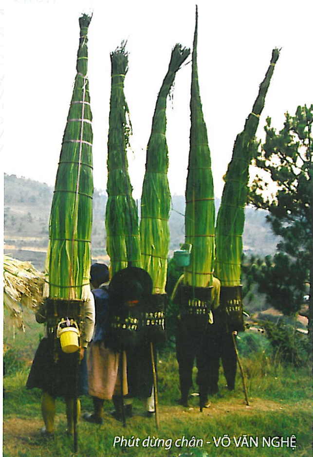
Phút dừng chân - VÕ VĂN NGHỆ