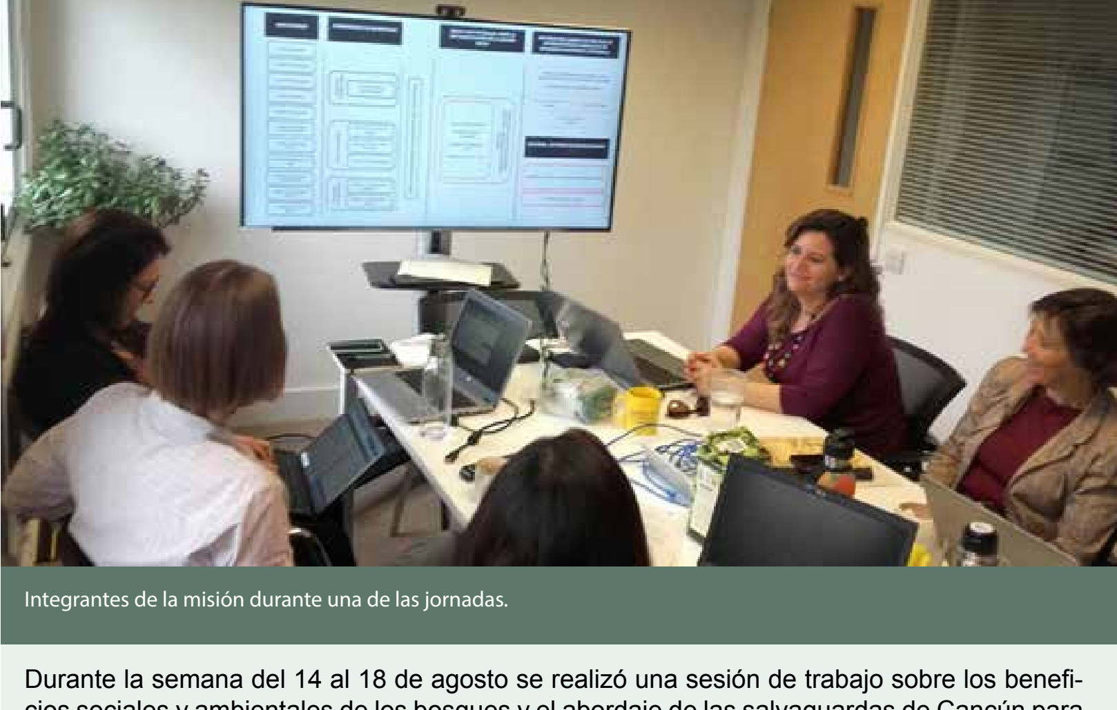
Integrantes de la misión durante una de las jornadas.

Durante la semana del 14 al 18 de agosto se realizó una sesión de trabajo sobre los beneficios sociales y ambientales de los bosques y el abordaje de las salvaguardas de Cancún para REDD+ en Argentina.