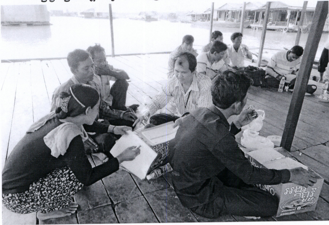
រូបភាពទី១ សកម្មភាព ចុះបញ្ជីអវត្តមាននៃអាជ្ញាធរមូលដ្ឋាន និងប្រជាពលរដ្ឋចូលរួម