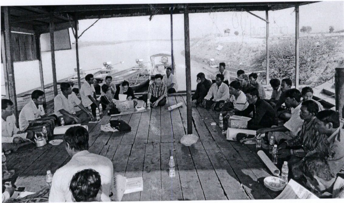
រូបភាពទី២ សកម្មភាពសំណោះសំណាល និងណែនាំខ្លួន មុនធ្វើការផ្សព្វផ្សាយផ្ទាំងរូបភាពនៃអត្ថប្រយោជន៍ព្រៃលិចទឹក