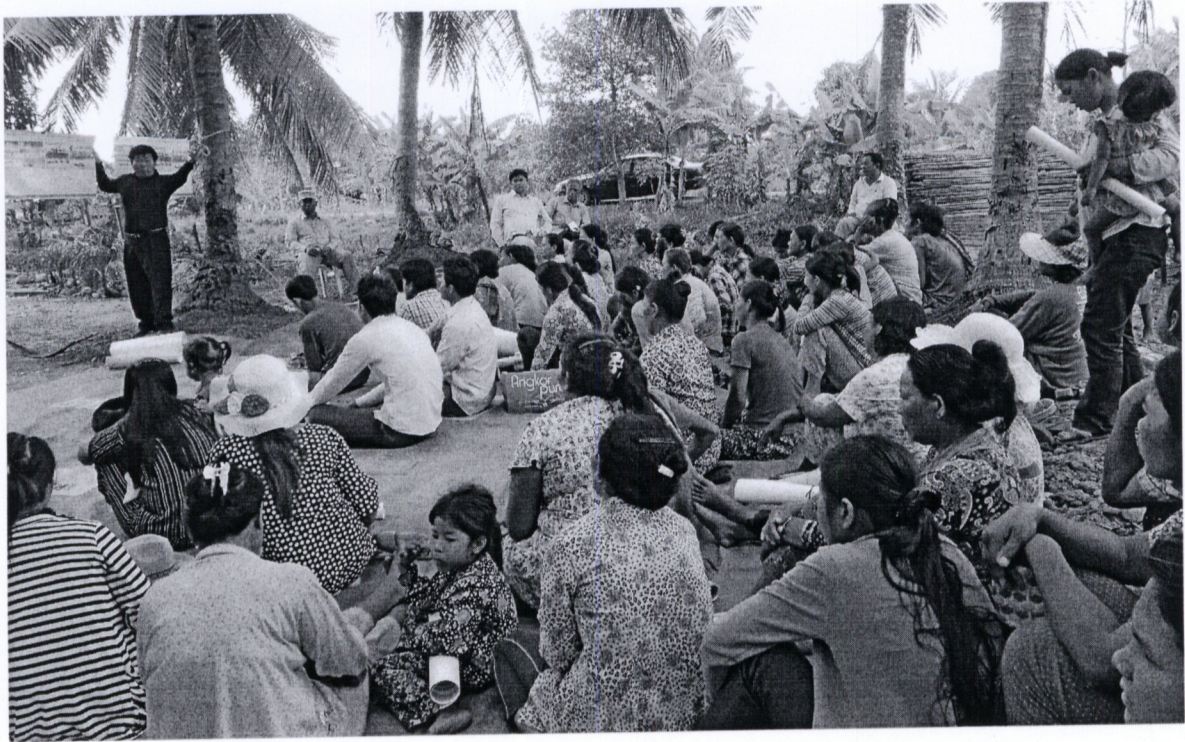
រូបភាពទី៣ សកម្មភាពសួររបញ្ជាក់ឡើងវិញ ដល់អ្នកចូលរួមដើម្បីវាស់វែងការយល់ដឹងរបស់គាត់កំរិតណា គ្រោយពីក្រុមអ្នកសម្របសម្រួលបានបង្ហាញនិងពន្យល់ដល់ពួកគាត់