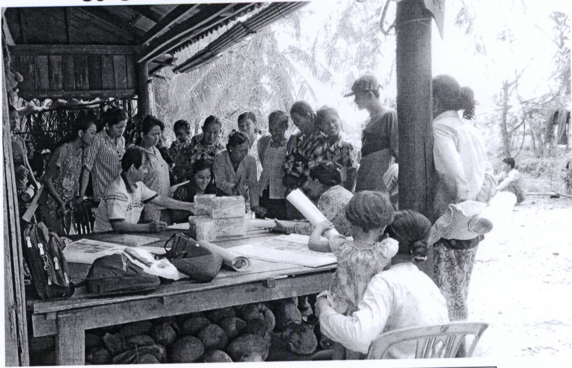
រូបភាពទី១ សកម្មភាព ចុះបញ្ជីអវត្តមាននៃអាជ្ញាធរមូលដ្ឋាន និងប្រជាពលរដ្ឋចូលរួម