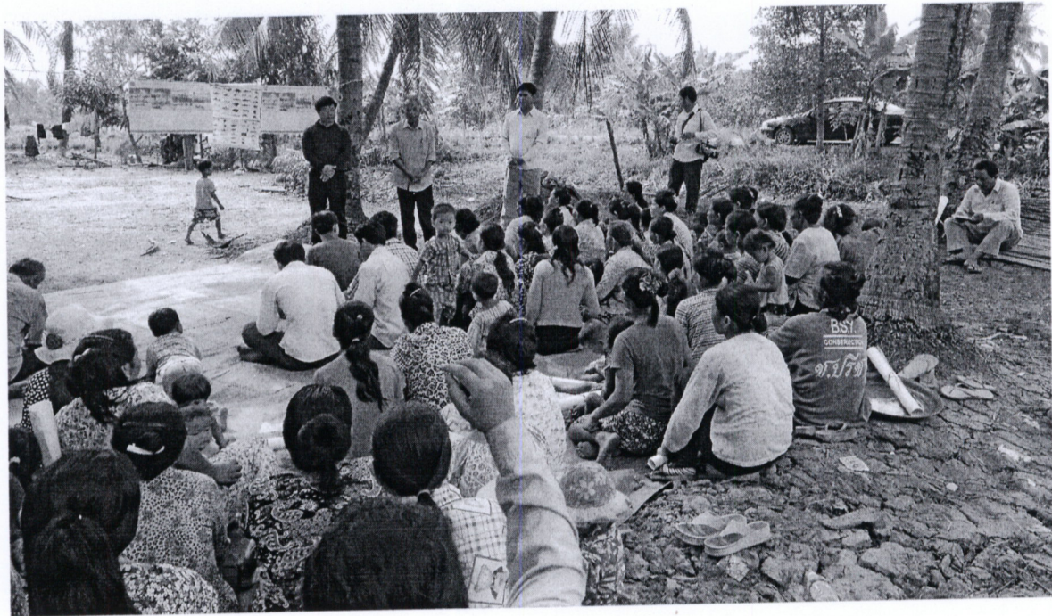
រូបភាពទី២ សកម្មភាពសំណេះសំណាល និងណែនាំខ្លួន មុនធ្វើការផ្សព្វផ្សាយផ្ទាំងរូបភាពនៃអត្ថប្រយោជន៍ព្រៃលិចទឹក