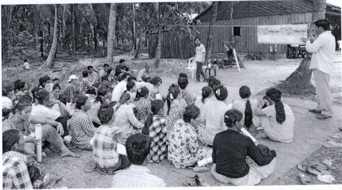
រូបភាពទី៤ សកម្មភាពពន្យល់ និងបញ្ជាក់បន្ថែម អំពីសារៈសំខាន់នៃព្រលិតទឹករបស់នាយខណ្ឌ រដ្ឋបាលជលផលដល់ប្រជាពលរដ្ឋដែលបានចូលរួម