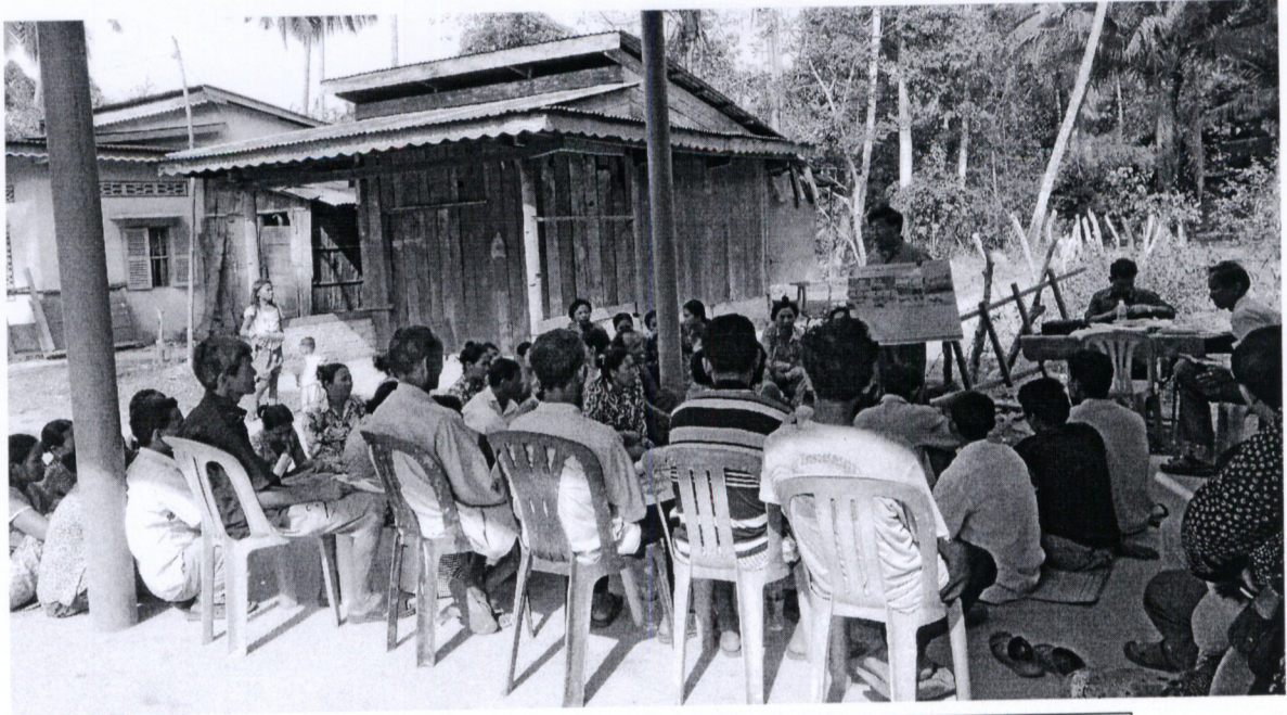
រូបភាពទី៣ សកម្មភាពបង្ហាញ និងពន្យល់ផ្ទាំងរូបភាព អំពីអត្ថប្រយោជន៍នៃព្រៃលិចទឹក