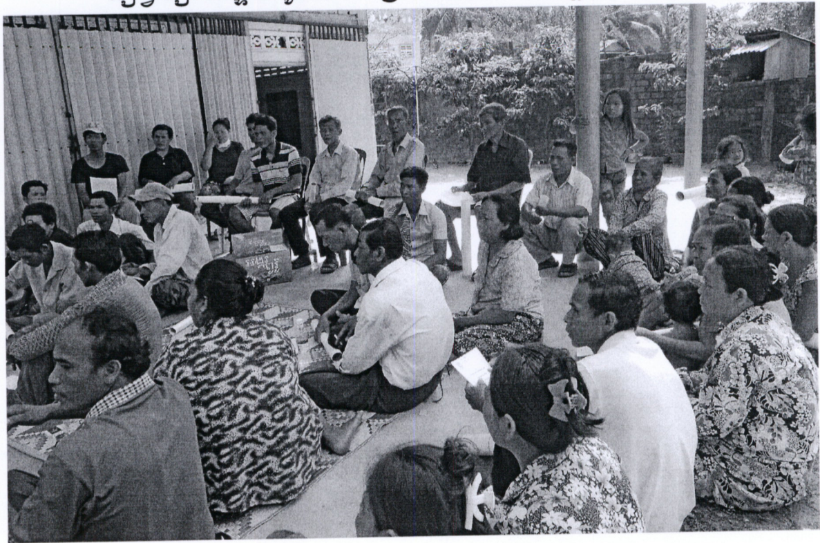
រូបភាពទី១ សកម្មភាព ចុះបញ្ជីអវត្តមាននៃអាជ្ញាធរមូលដ្ឋាន និងប្រជាពលរដ្ឋចូលរួម