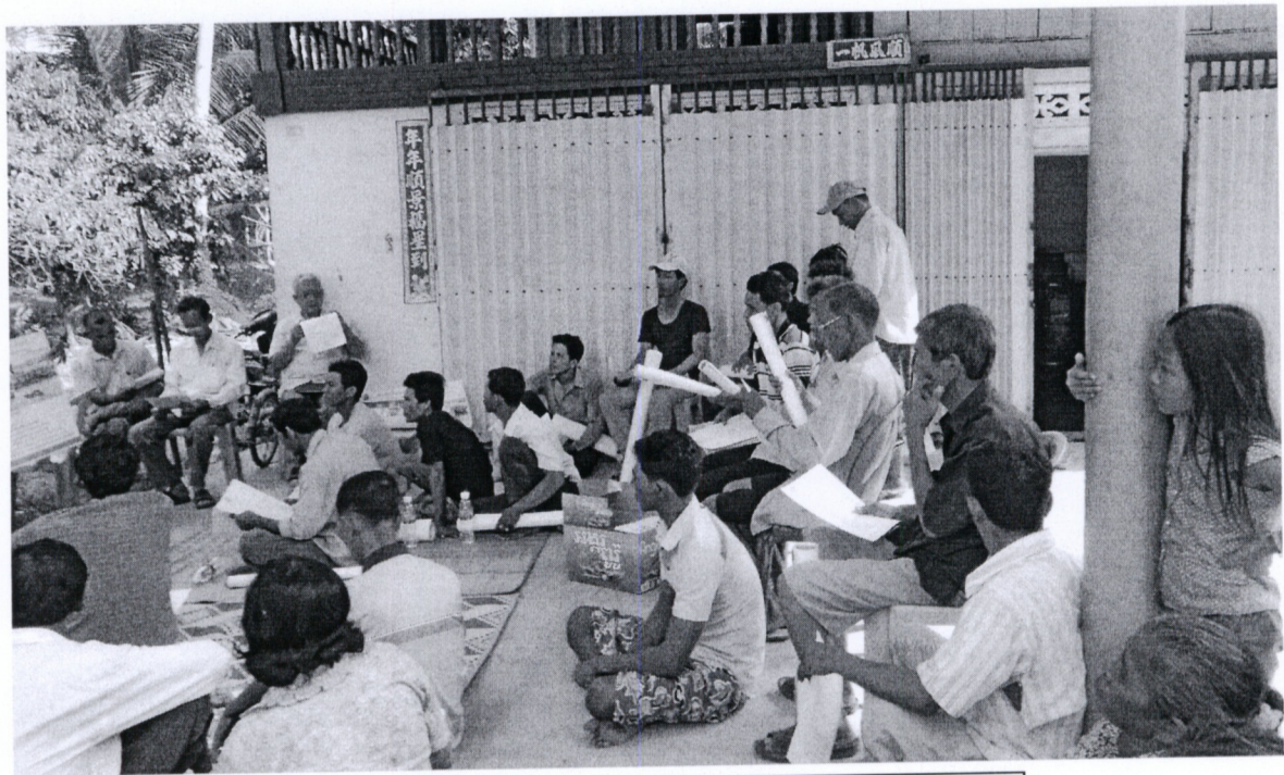
រូបភាពទី២ សកម្មភាពចែកចាយផ្ទាំងរូបភាព មុនធ្វើការផ្សព្វផ្សាយ អត្ថប្រយោជន៍នៃព្រៃលិចទឹក