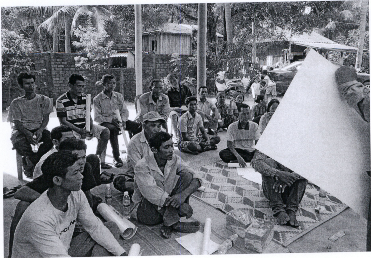
រូបភាពទី៤ សកម្មភាពសួររបញ្ជាក់ឡើងវិញ ដល់អ្នកចូលរួមដើម្បីវាស់វែងការយល់ដឹងរបស់គាត់កំរិតណា ក្រោយពីក្រុមអ្នកសម្របសម្រួលបានបង្ហាញនិងពន្យល់ដល់ពួកគាត់