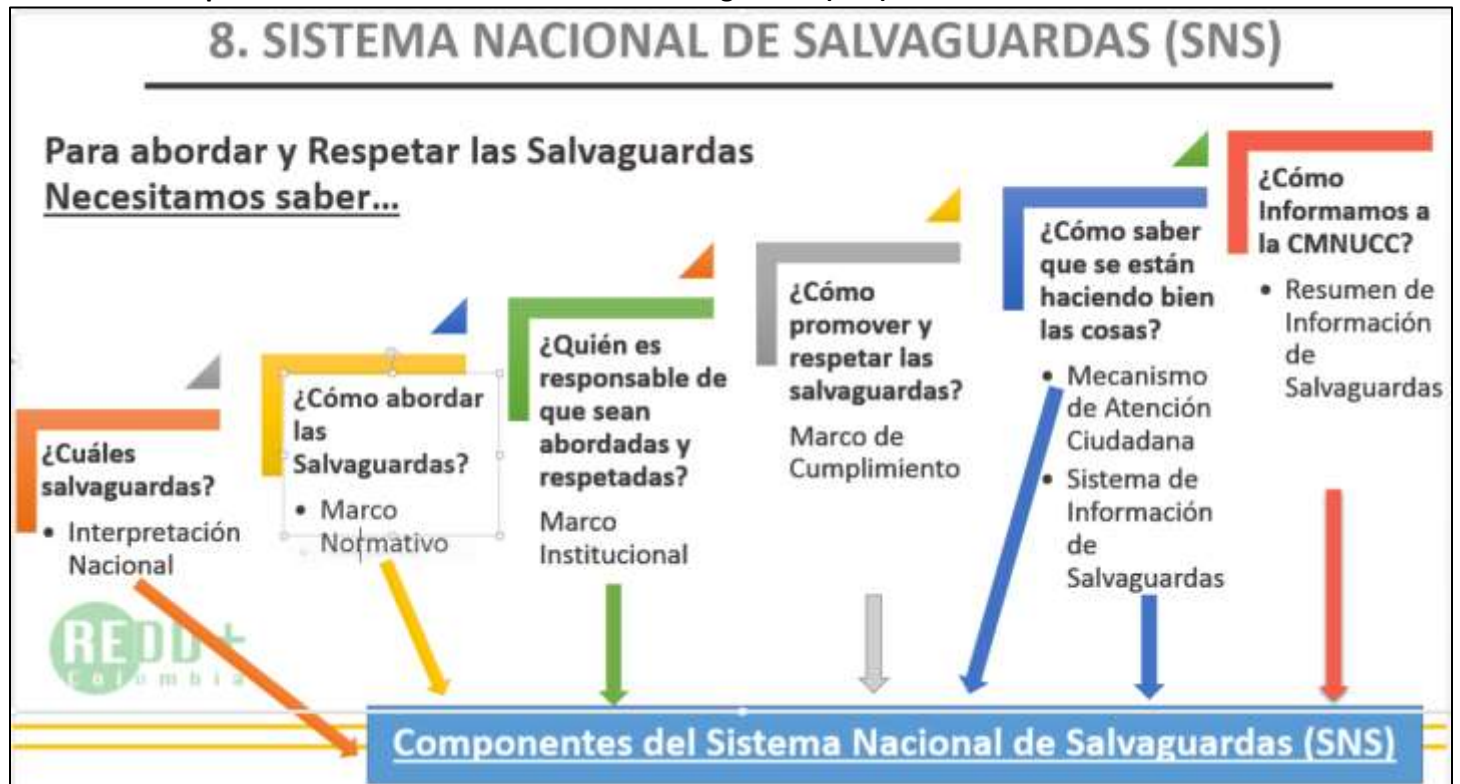
Gráfico 1. Conceptualización del Sistema Nacional de Salvaguardas (SNS) de Colombia

Salvaguardas sociales y ambientales para REDD+ en Colombia. Programa ONU-REDD Colombia, 2016.