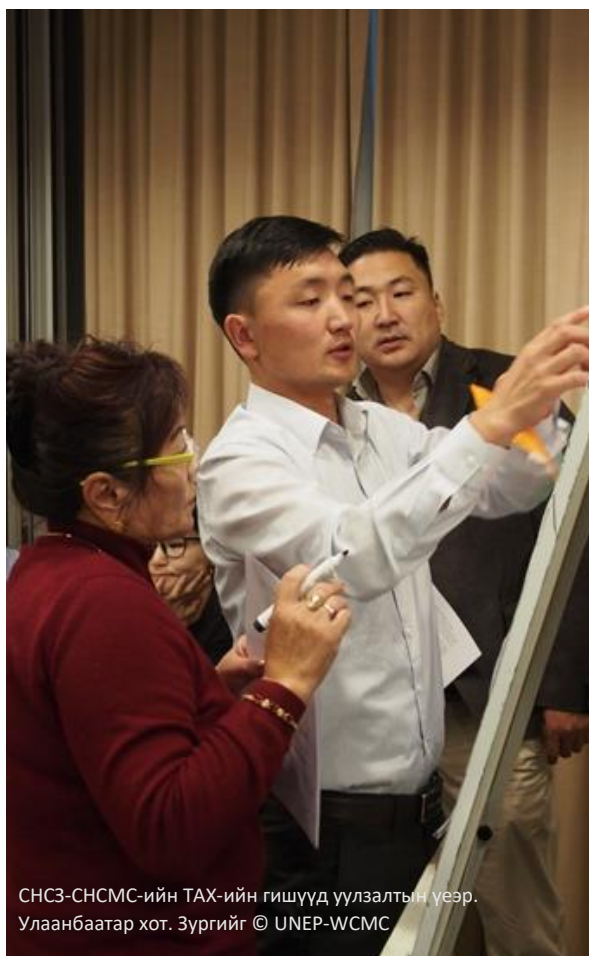
СНСЗ-СНСМС-ийн ТАХ-ийн гишүүд үүлзалтын үеэр. Улаанбаатар хот.

Харин дээрх БХЖ, холбогдох үйл ажиллагаануудыг бодит байдал дээр үр дүнтэй хэрэгжүүлж, тодорхой нааштай үр өгөөж гарсан тохиолдолд сая СНСЗ-ууд