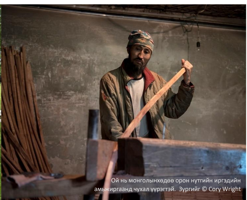
Ой нь монголынхөдөө орон нутгийн иргэдийн амьжиргаанд чухал үүрэгтэй.